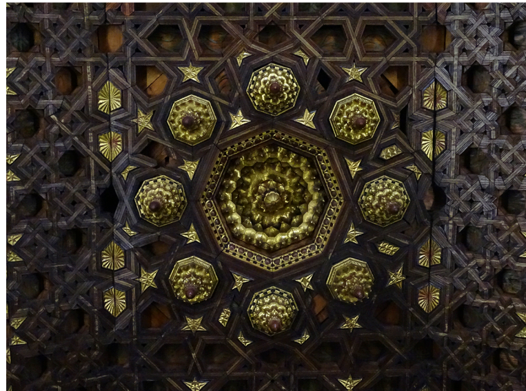
Fig 1: Almizate. Iglesia de San Francisco. Quito, Ecuador. (Siglo XVI).

la persistencia de la carpintería de lo blanco en la arquitectura religiosa virreinal de Andinoamérica (siglos XVI-XVIII).