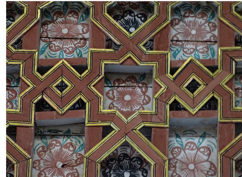
Fig 2: Detalle de la cubierta de la nave central de la Iglesia de San Miguel de Sucre, Bolivia (inicios siglo XVII).