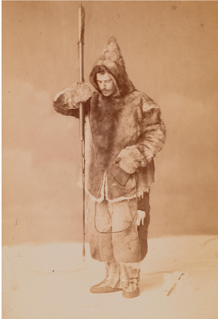
Fig. 1. Anonyme, Franz Boas en habits d'Inuit de Baffin Island , 1883-1884. American Philosophical Society Library, Philadelphie, Fonds Boas Mss.B.B61.