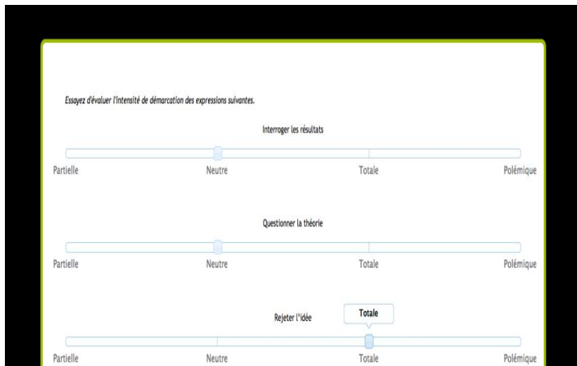
Figure 3 : Exercice d'évaluation de l'intensité des collocations

Ensuite des extraits plus longs (deux phrases) sont proposés afin d'aider l'apprenant à cerner les contextes d'utilisation des collocations transdisciplinaires. La fin de la séquence n'est pas terminée en ligne, cependant, l'apprenant sera alors placé devant une partie triée du corpus pour une utilisation d'abord guidée puis individuelle de ce dernier. L'idée est de guider, de façon progressive, l'apprenant vers l'utilisation du corpus afin qu'il trouve seul les extraits appropriés à ses attentes (Chambers, 2010/2). Le parcours de travail envisagé en ligne sera alors le suivant :