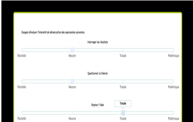
Figure 3 : Exercice d'évaluation de l'intensité des collocations

Ensuite des extraits plus longs (deux phrases) sont proposés afin d'aider l'apprenant à cerner les contextes d'utilisation des collocations transdisciplinaires. La fin de la séquence n'est pas terminée en ligne, cependant, l'apprenant sera alors placé devant une partie triée du corpus pour une utilisation d'abord guidée puis individuelle de ce dernier. L'idée est de guider, de façon progressive, l'apprenant vers l'utilisation du corpus afin qu'il trouve seul les extraits appropriés à ses attentes (Chambers, 2010/2). Le parcours de travail envisagé en ligne sera alors le suivant :