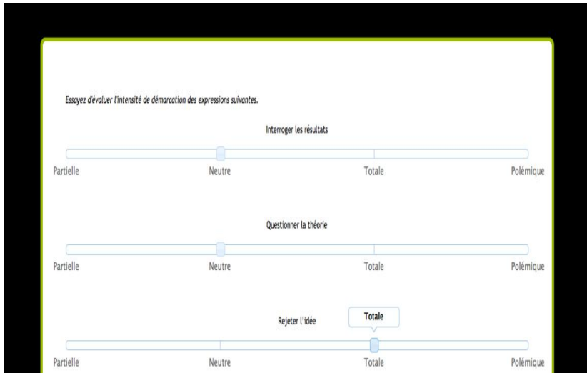
Figure 3 : Exercice d'évaluation de l'intensité des collocations

Ensuite des extraits plus longs (deux phrases) sont proposés afin d'aider l'apprenant à cerner les contextes d'utilisation des collocations transdisciplinaires. La fin de la séquence n'est pas terminée en ligne, cependant, l'apprenant sera alors placé devant une partie triée du corpus pour une utilisation d'abord guidée puis individuelle de ce dernier. L'idée est de guider, de façon progressive, l'apprenant vers l'utilisation du corpus afin qu'il trouve seul les extraits appropriés à ses attentes (Chambers, 2010/2). Le parcours de travail envisagé en ligne sera alors le suivant :